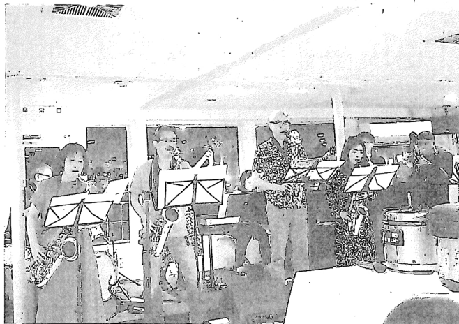
ジャズ演奏の一コマ。左から二番目が会沢部長